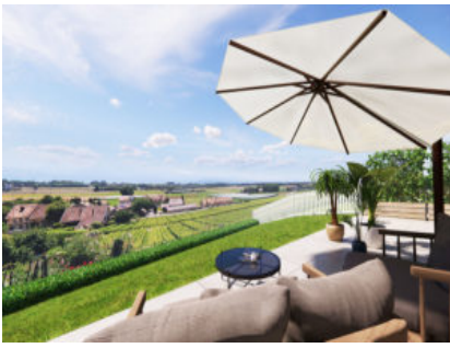
Vinzel-Les Terrasses du Château Vinzel-Les Terrasses du Château