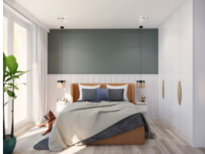
Vinzel-Les Terrasses du Château