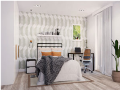
Vinzel-Les Terrasses du Château