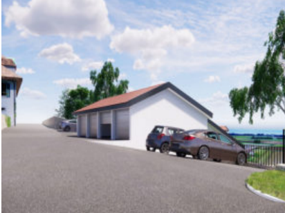
Vinzel-Les Terrasses du Château