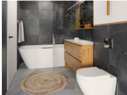
Vinzel-Les Terrasses du Château