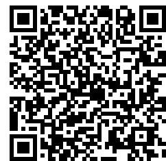
Vinzel-Les Terrasses du Château