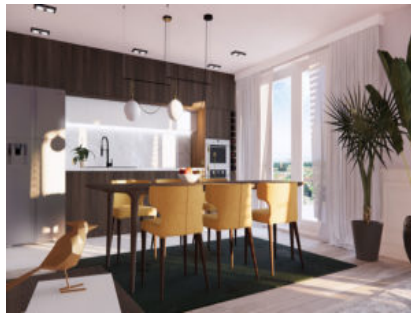
Vinzel-Les Terrasses du Château