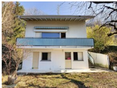
villa côté ouest