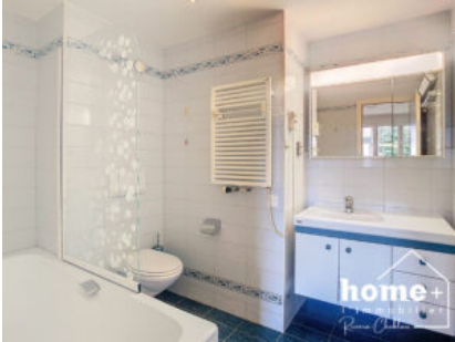
Salle de bains attenante