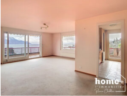
Pièce de vie actuelle