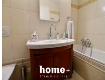
salle de bains