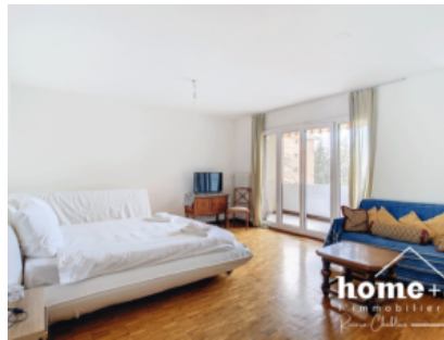
Pièce à vivre / Chambre