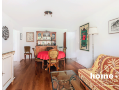
Pièce à vivre