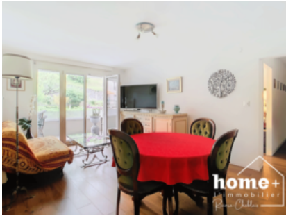
Pièce à vivre